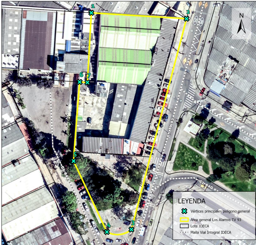
Fuente: Documento técnico de soporte de fecha 04 de septiembre de 2025

Que mediante radicado No. 20254000381432 de fecha 29 de diciembre de 2025, el Instituto Distrital de Recreación y Deportes - IDRDR expidió concepto de no objeción en cumplimiento de lo dispuesto por el protocolo de reglamentación respectivo.