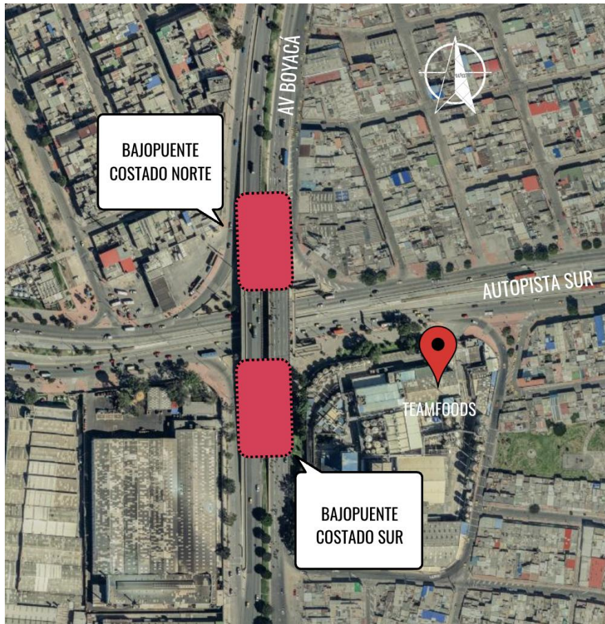
TABLA No.3 ESPACIO PÚBLICO