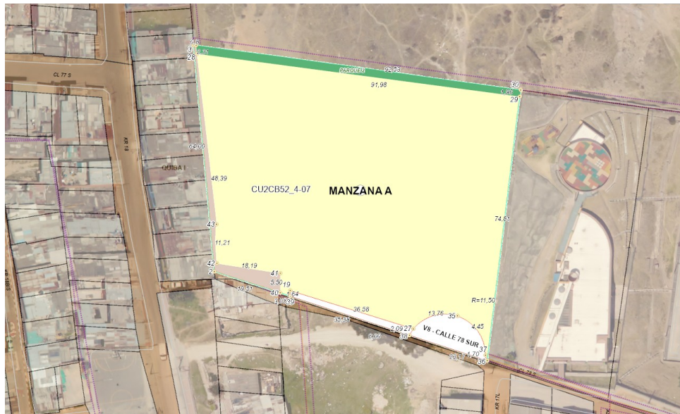
IMAGEN 1: Plano urbanístico CU2.CB52/4-07.

De otro lado, al consultar la ubicación del urbanismo en mención en el aplicativo SINUPOT de la Secretaría Distrital de Planeación, se evidenció la existencia del plano urbanístico CU2.CB52/4-07, el cual incluye las zonas de cesión mencionadas en su comunicación.