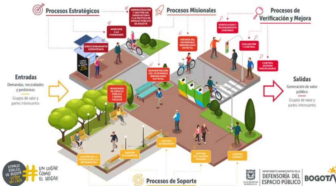
Ilustración 2. Mapa de procesos DADEP

El diagrama del mapa de procesos es el siguiente: