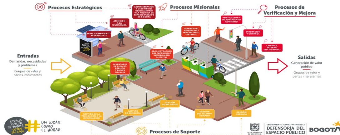
Ilustración 2. Diagrama del mapa de procesos

El diagrama del mapa de procesos es el siguiente: