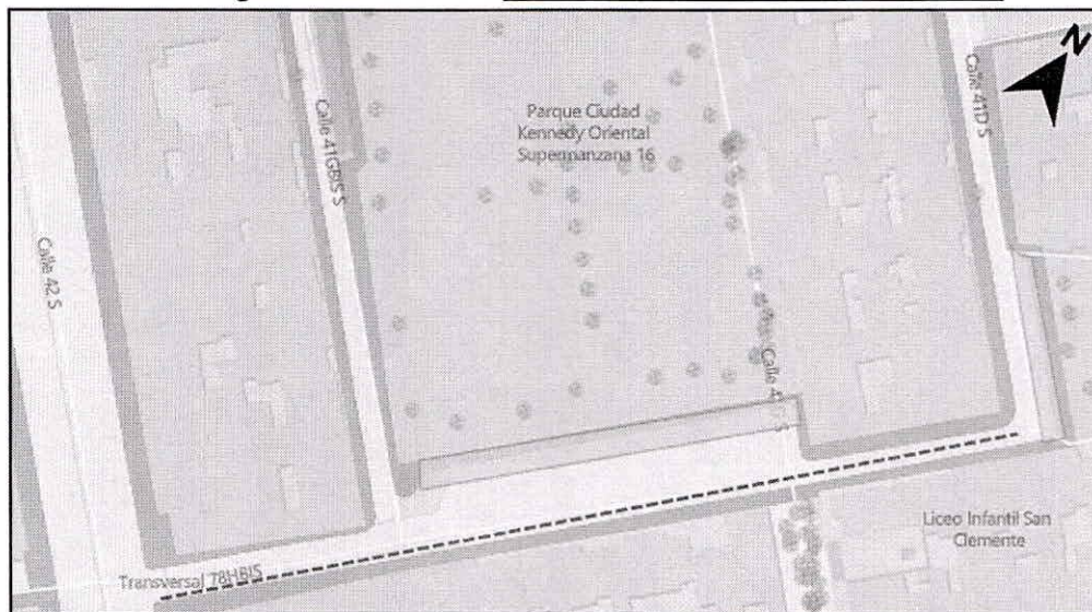
Figura 2. Localización: TV 78H BIS - CL 41D SUR / CL 42 SUR