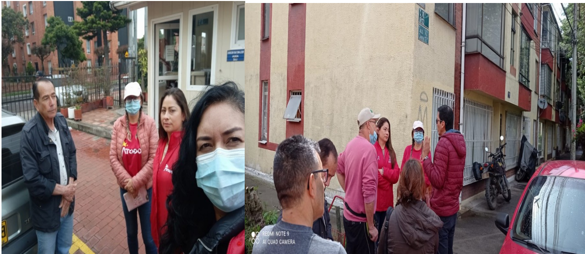
Fotografías tomadas acercamiento con la comunidad Urb. Parques del Campo,

organizaciones cívicas, mediante un procedimiento persuasivo desarrollando talleres, compromisos y actas de entrega voluntaria del espacio público, así las cosas, con el propósito de llegar a un acuerdo, sin perjuicio a la competencia que tiene la Alcaldía Local de Suba, para la protección, recuperación y conservación del espacio público indebidamente ocupado, este Departamento a través de profesionales del área de Defensa, realizaron visita a la ocupación indebida, el día 29 de mayo de 2023, con el fin de iniciar proceso de restitución del espacio público. Como se muestra en el registro fotográfico: