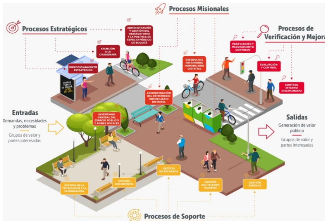
Imagen 1 – Mapa de Procesos Institucionales de la Entidad en el marco del Sistema de Gestión